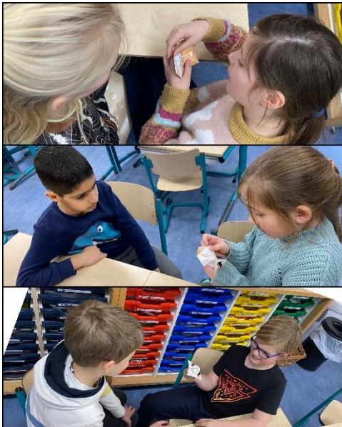
De les reflecteren in tweetallen d.m.v. de 'reflectiehapper'.

Als team zijn we druk bezig met de ontwikkeling van ons nieuwe schoolconcept. Een school met uitdagende, dynamische rijke schooldagen. Waar de leerling nog meer beseft dat hij ertoe doet. En waar we de wereld in de school halen. Kinderen die nu een minder rijke thuisomgeving hebben laten proeven aan de wereld om hen heen en dat ze nieuwsgierig worden naar de toekomst. En beseffen dat ze net zoveel kansen hebben als een ander, die wel uit een rijkere thuisomgeving komt. Dat verdienen de leerlingen van onze school.